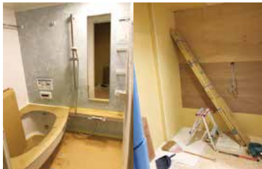
風呂場完成真近、洗面所はまだです

このコラムを書いている現在ですが、インフルエンザが大流行しています。年末から流行している感はありましたが、罹患者は例年以上に一気に増えている感じです。今年は乾燥が強いためか感染力が増しているようです。今年は単回経口の新薬ゾフルーザの利便性が優先されたためか治療の主流になっておりますが、私的には効果は今迄の抗インフルエンザ薬とそれほど変わりがないような印象です。そのゾフルーザですが発売から間もないのに10%程度の耐性株の報告もありA型インフルエンザには注意が必要かもしれません。治験では、もっと多かったようですが、B型では耐性株の報告はなかったようなので、利便性を優先する人には選択肢の一つとして考えてみるのも良いかもしれません。今はA型がほとんどですが、今後B型が流行する時期も来ると思いますので大変な年明けとなりそうです。私事になりますが、1月下旬より自宅の風呂と洗面所の改築工事が始まり、8日間程使用できない状況になりました。業者さんから近くのスパの入浴券を頂いたので子供達は