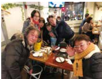
恒例の小林家親戚一同での新年会です。

毎晩喜んで大きなお風呂に入りに行っていますが……。私は中学生の時から朝風呂派で、このルーティーンを崩す事がどうしても出来ず、悩んだ末1人ホテル住まいにしました。残念ながら出来ませんでした。新しい風呂完成が待ち遠しいです。昨年度に続き、母校の日本医大から2月4日より2名の医学生の実習を受け入れる事になりました。(3月も2名の医学生を受け入れ予定です) ご迷惑をお掛けしないよう配慮しますが、ご協力の程宜しくお願い致します。