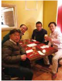
日本医大千葉北総OBです。皆後輩ですが、開業医で頑張っています！

ようやくインフルエンザの流行も一段落してきましたが、昨年度は風疹が流行したり、麻疹が今年は早くも昨年度を追い抜くような勢いで増えたりと感染症関連の話題が巷を賑わせています。医療界では技術やデバイスの進化、あるいは新薬の登場により今迄太刀打ちできなかった疾患にも対応できるようになりました。